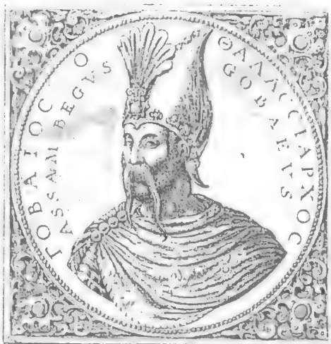
Uzun Həsən Ağqoyunlu (1423/24 – 1478)

Uzun Həsən vaxtaşırı toplanan nizamsız feodal qoşunları əvəzinə daimi ordu yaratmaq üçün oturaq əhali içərisindən çıxan süvari dəstələrinin sayını artırdı. O,